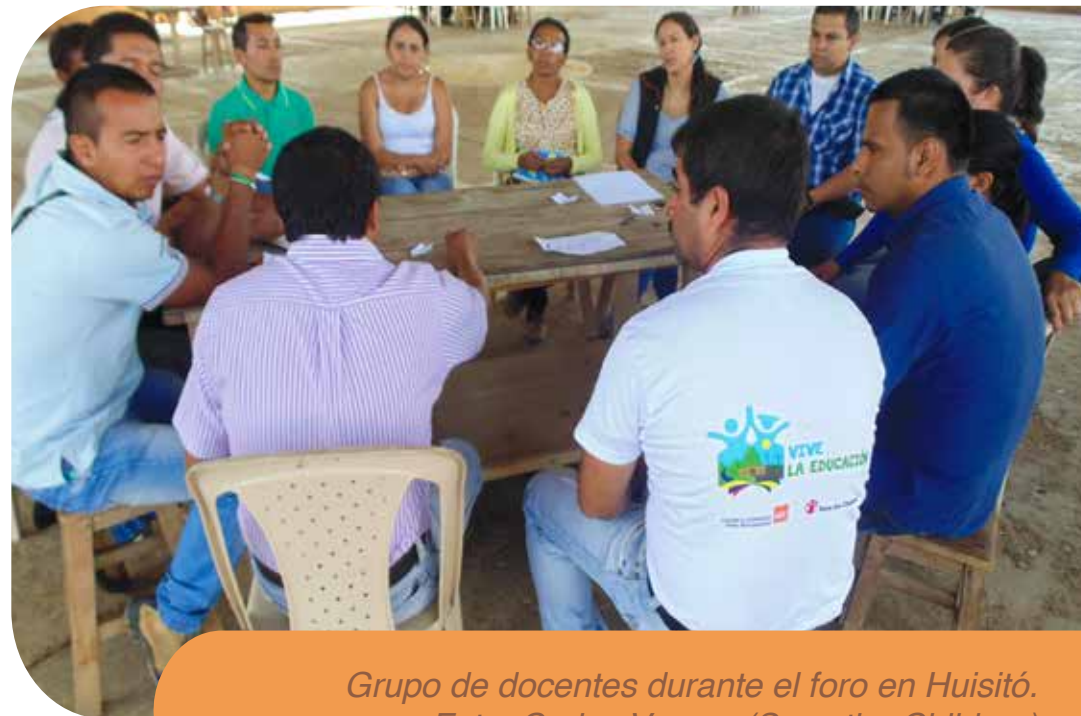
Grupo de docentes durante el foro en Huisitó.

Vive la Educación organizó el I Foro Educativo Municipal en Huisitó, donde participaron directivos docentes de instituciones educativas la Alcaldía Municipal, Comité de Educación del Concejo Municipal y la Secretaría de Educación Departamental. La actividad tuvo como objetivo el avance en prospectiva de procesos educativos de calidad, mediante el abordaje de aspectos clave como el análisis de alternativas para la sostenibilidad de procesos educativos municipales; y definición de acciones para fortalecer estrategias de reconocimiento e intercambio de experiencias pedagógicas. Los compromisos de la Secretaría y de la Alcaldía permitirán la construcción del Plan Educativo Municipal de El Tambo.