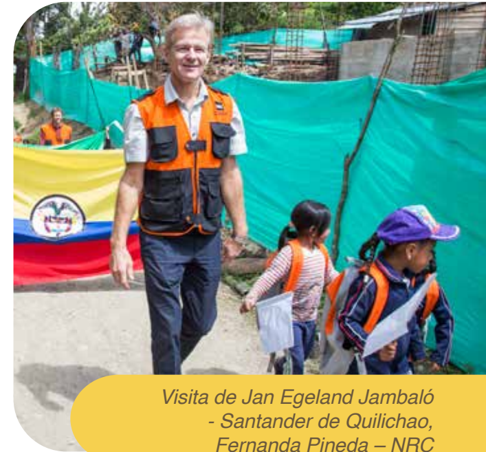
Visita de Jan Egeland Jambaló - Santander de Quilichao

El Secretario General del Consejo Noruego para Refugiados (NRC), Jan Egeland, visitó las zonas donde se implementa Vive la Educación. El representante destacó la relevancia de esta iniciativa que se realiza en forma conjunta con Save the Children: “Durante mi visita conocí muchos niños, niñas y jóvenes que por años no han tenido acceso a la escuela por el conflicto. Estamos hablando de una generación completa que tiene una desesperada necesidad de un futuro más próspero”. En esta edición del Boletín Vive la Educación se abordan intervenciones que buscan atenuar el efecto del conflicto armado en cuanto al acceso a una educación de calidad, por ejemplo, la Bolsa Concursable para fortalecer la gestión pedagógica, el Plan Educativo Municipal de El Tambo y los resultados del Censo de Desescolarización 2014 en Cauca y Nariño. Estas acciones logran atenuar las difíciles condiciones para educarse en Cauca y Nariño, las cuales requieren atención urgente, según señala Egeland: “Las escuelas se están convirtiendo en campos de batalla en algunas regiones del país. Las partes del conflicto deben respetar la inviolabilidad de las instituciones educativas”.