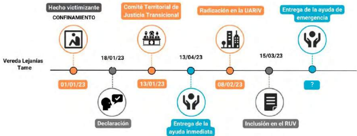
Gráfica 7. Línea de tiempo de la ruta de atención al hecho victimizante de confinamiento en el municipio de Tame.