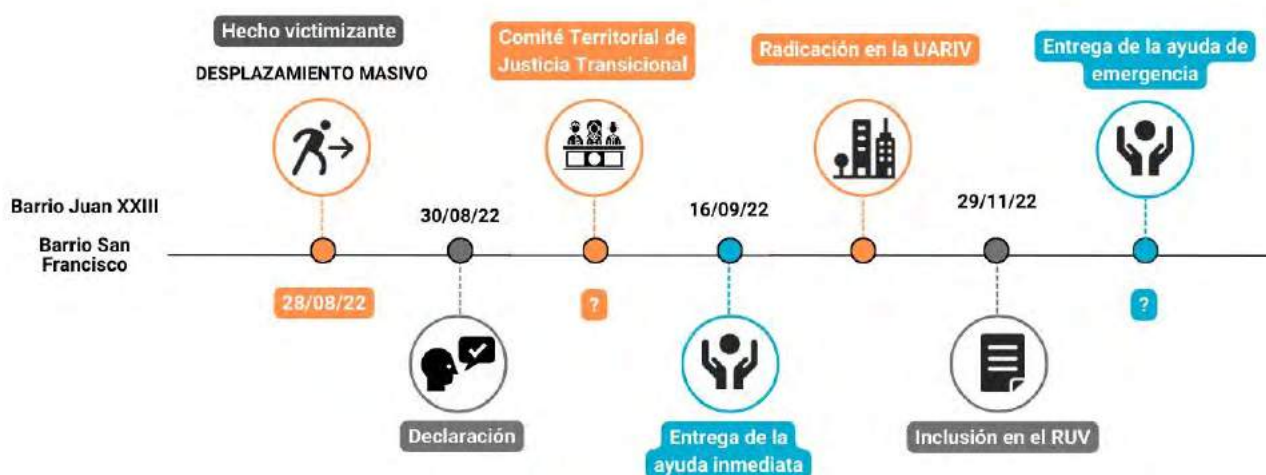
Gráfica 2. Línea de tiempo de la ruta de atención al hecho victimizante de desplazamiento forzado en el municipio de Buenaventura (zona Urbana).