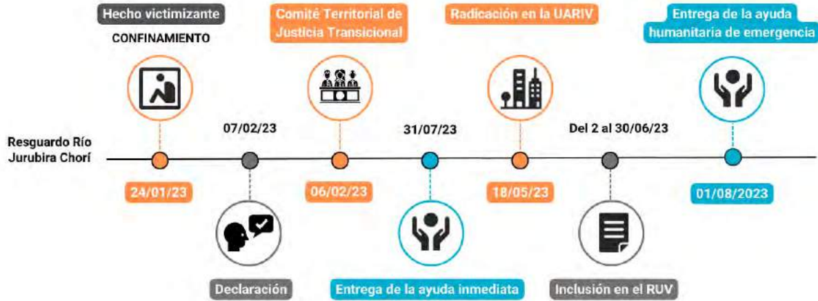
Gráfica 4. Línea de tiempo de la ruta de atención al hecho victimizante de confinamiento en el municipio de Alto Baudó, Resguardo Jururiba Chorí.