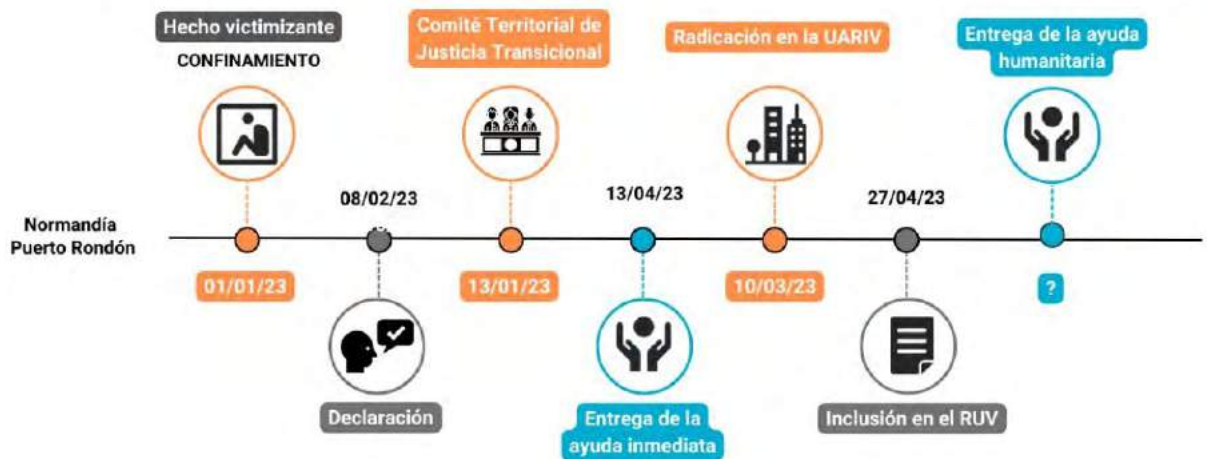
Gráfica 8. Línea de tiempo de la ruta de atención al hecho victimizante de confinamiento en el municipio de Puerto Rondón.