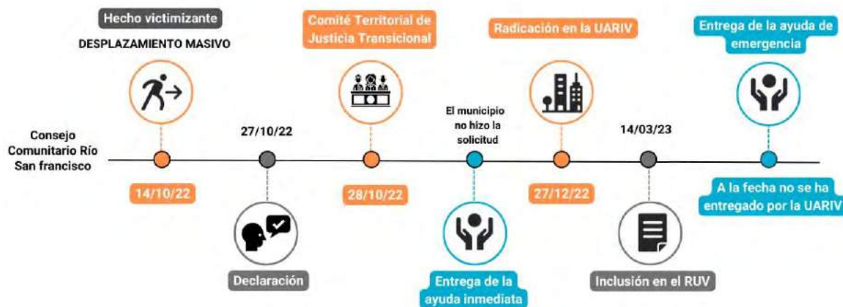
Gráfica 1. Línea de tiempo de la ruta de atención al hecho victimizante de desplazamiento forzado en el municipio de Guapi.