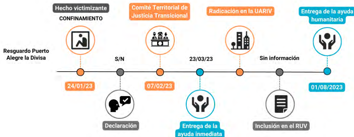
Gráfica 6. Línea de tiempo de la ruta de atención al hecho victimizante de confinamiento en el municipio de Alto Baudó, Resguardo Puerto Alegre la Divisa.